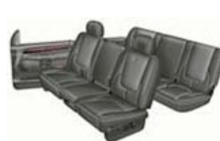
DV - Dark Slate Gray