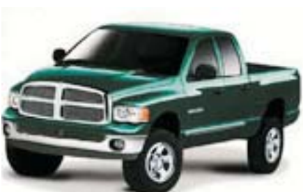
6F5 - Timberline Green Pearl