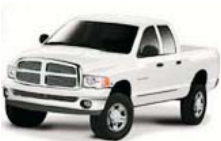
6FA - Bright White Clearcoat