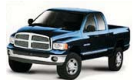
6FC - Patriot Blue Pearlcoat