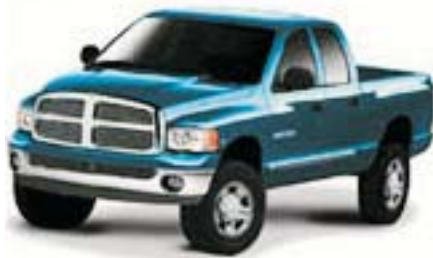
6F6 - Atlantic Blue Pearlcoat