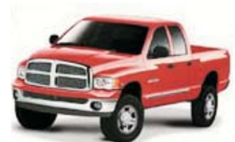
6F8 - Flame Red Clearcoat