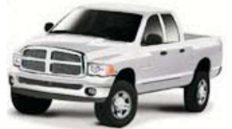
6FD - Bright Silver met. Clearcoat