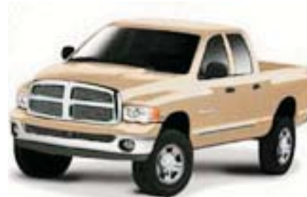
6F4 - Light Almond Pearl met.