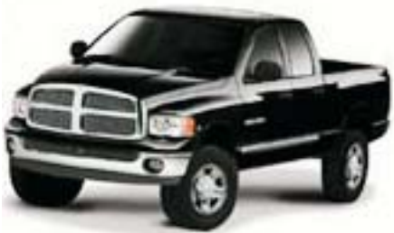
6F2 - Black Clearcoat