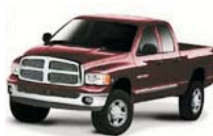
6F3 - Deep Molten Red Clearcoat