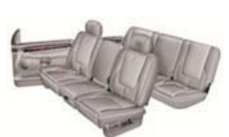
L5 - Taupe