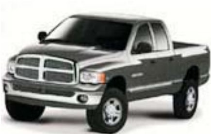
6F7 - Graphite met. Clearcoat